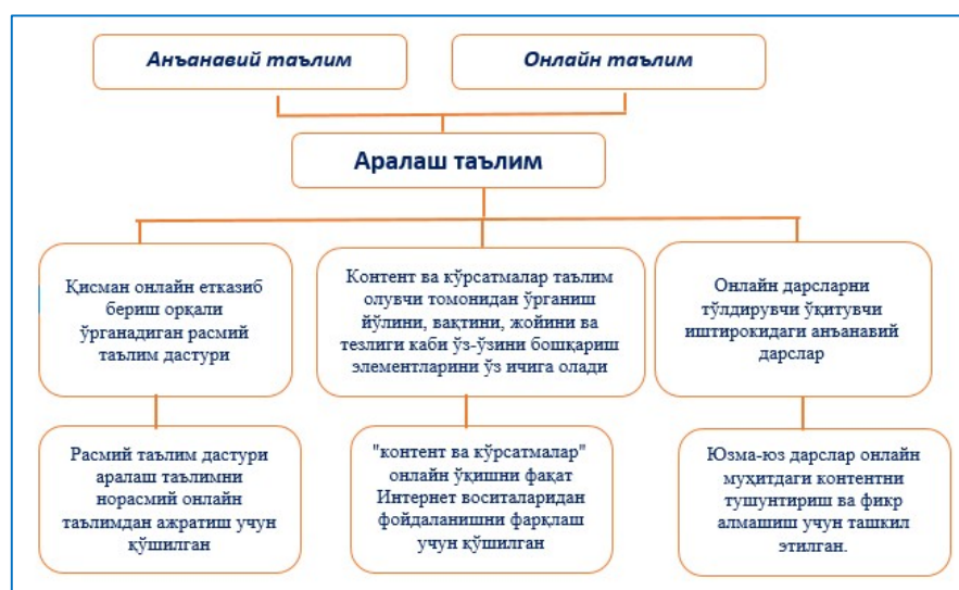
1-расм. Аралаш таълимнинг изоҳланган таърифи.

Юқори технологиялар асосида ташкил этилган анъанавий дарс жараёнини ташкил этишда электрон доска, Интернет технологиялари, веб-камералар, электрон, смарт технологиялар, виртуал технологиялардан фойдаланиш назарда тутилади. Контент ва кўрсатмалар интернетга жойлаштирилмаган ҳолда бўлади ёки агар жойлаштирилган бўлса ҳам, талабанинг вақт, жой, усул ва тезлигини бошқариш элементлари мавжуд бўлмайди. Демак, аралаш таълим тушунчасини изоҳлашда жараёндаги бошқариш элементларга асосий эътиборни қаратиш лозим бўлади: