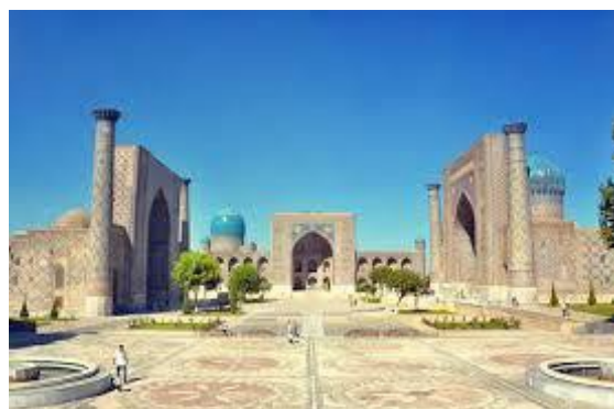
Регистон. Самарқанд. XV–XVII асрлар.

Хуллас, Ўзбекистон санъатида темурийлар мавзуси истиқлол туфайли янада долзарб масалалардан бирига айланди. Бу борада юзлаб рангтасвир асарлари яратилди ва яратилмоқда.