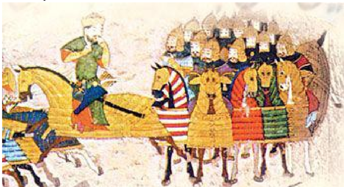
Бу даврни ўрганганда уларни учта йўналишга ажратиб таҳлил қилишни лозим топдик. Булар: темурийлар даври тасвирий ва амалий санъати; темурийлар даври ёдгорликларини ўрганилишининг долзарб муаммолари; темурийлар даврида тил ва адабиёт масалалари.

Бугунги кунда дунё ҳамжамияти томонидан Амир Темур ва Темурийлар даври маданияти ва санъатига нисбатан “Иккинчи ўйғониш даври” деган баҳонинг берилиши ҳам бежиз эмас. Чинданда бу даврда Хуросон ва Моворауннаҳрда маънавий, ижтимоий ҳаётнинг деярли барча соҳаларида юксак тараққиёт даражасига эришилган. Юқорида номи тилга олинган беназир шахслар томонидан яратилган нодир асарлар ҳам шундан далолат беради.