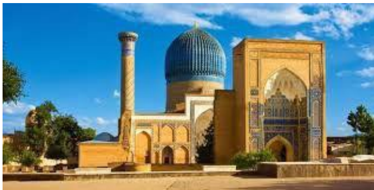
Гўри Амир мақбараси. Самарқанд.1404 й.

Темурийлар сулоласининг бошқа вакиллари ҳам рангтасвирчилар томонидан катта қизиқиш билан тасвирланди.