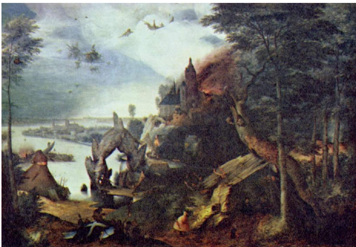
П. Брейгель. Искушение святого Антония

Арабские, персидские, индийские и китайские тексты, переведённые на латынь, французский и другие европейские языки, а также старинные и современные описания путешествий были первоочередными экзотическими источниками французской и европейской романтики. Кроме того, многие из французских писателей-романтиков ездили в восточные страны. Шатобриан написал свой «Путь из Парижа в Иерусалим и из Иерусалима в Париж» (1811), а Нерваль своё «Путешествие на Восток» (1851). Флобер тоже съездил в Египет и в Средиземноморье после завершения первой версии «Искушения святого Антония», создав своё собственное «Путешествие на Восток» (1849–1852).