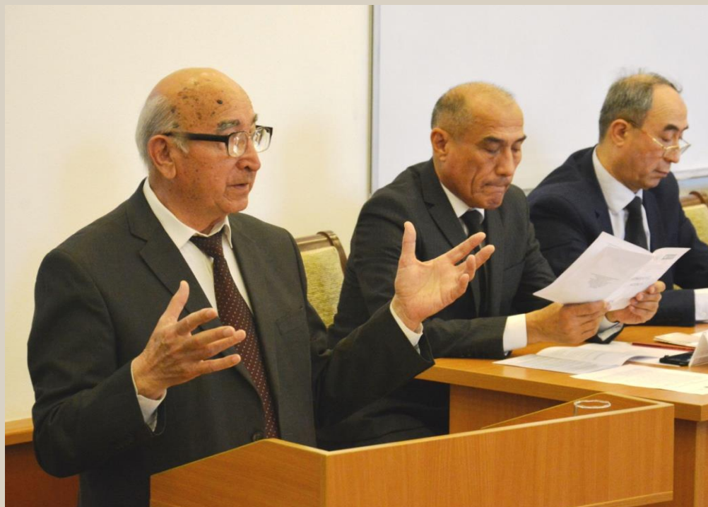
На конференции в Университете узбекского языка и литературы. 2017 г.

его деяниях. Именно в этом и заключается её могучая сила. Сохранение и изучение, передача из поколения в поколение исторического наследия является одним из главных приоритетов нашего государства».